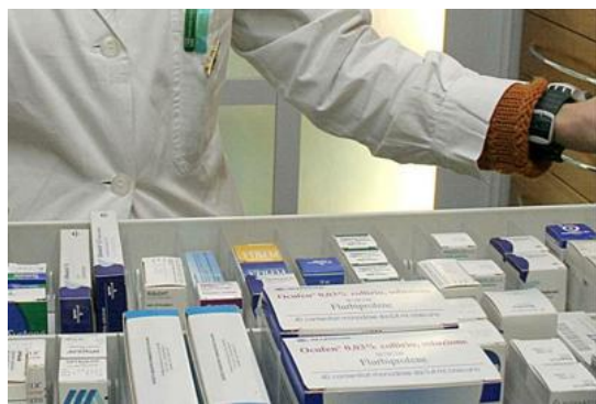
Immagine di repertorio (Fotogramma)